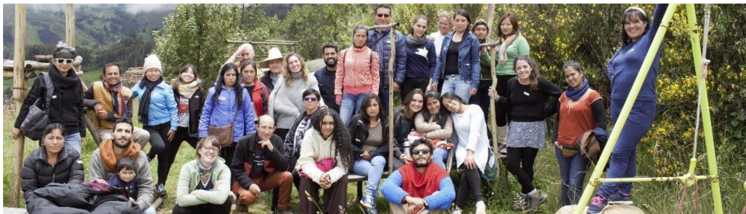
Imagen: Primer Seminario Pluriversidad Latinoamericana – Huamachuco, inicio 2018

Dirección: Prolongación Suarez N° 200 Huamachuco, La Libertad, Perú