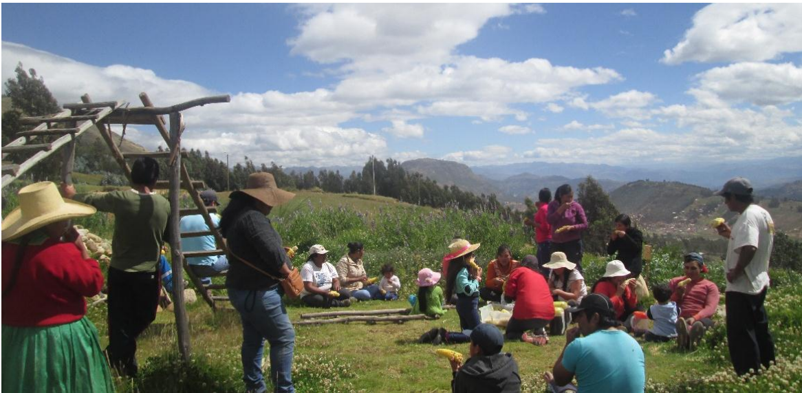
Imagen: Escuela Democrática de Huamachuco

Es muy importante para nosotros, garantizar la práctica de los derechos humanos, la equidad social y la participación de cada persona de la comunidad en las decisiones; asimismo generar espacios de escucha, libertad, respeto, legitimación de saberes locales.