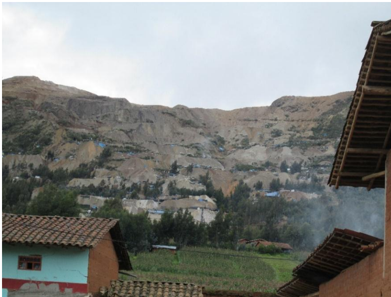
Imagen: Cerro "El Toro" – Huamachuco

Huamachuco, capital de la provincia de Sánchez Carrión, es un pueblo ubicado en pleno corazón de los Andes del norte del Perú. Cuenta con aproximadamente 53 mil habitantes. Según el PNUD - 2013 (Programa de las Naciones Unidas para el Desarrollo), esta jurisdicción se encuentra entre las 3 provincias más pobres del Perú y en sus entrañas tiene a Curgos, el distrito más empobrecido del Perú (Fuente: INEI - 2015).